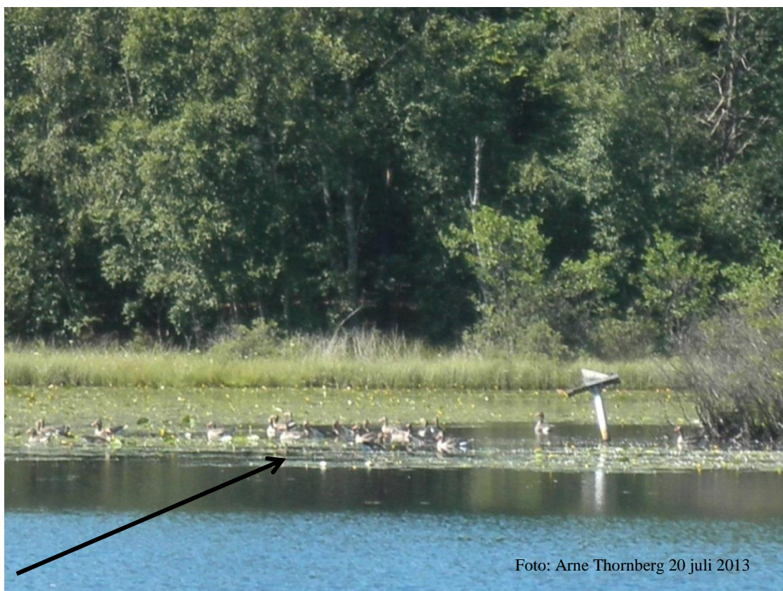
20 juli 2013