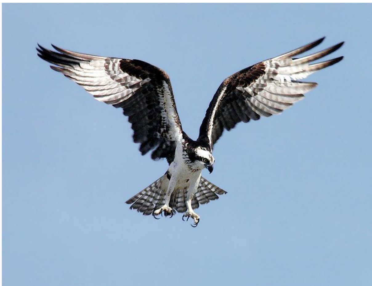
Fiskljuse. Från wikipedia ( www.sv.wikipedia.org/wiki/Fiskgjuse )